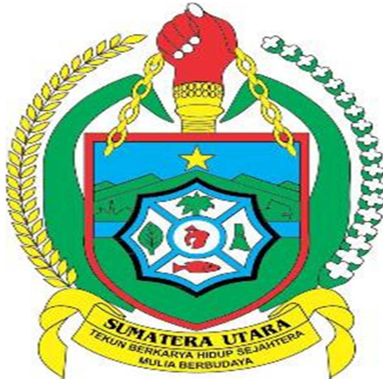
Gambar 2. 1 Logo Dinas Tanaman Pangan dan Hortikultura di Sumatera Utara.

Logo Dinas Tanaman Pangan dan Holtikultura Provinsi Sumatera Utara memiliki makna tertentu diantaranya sebagai berikut: