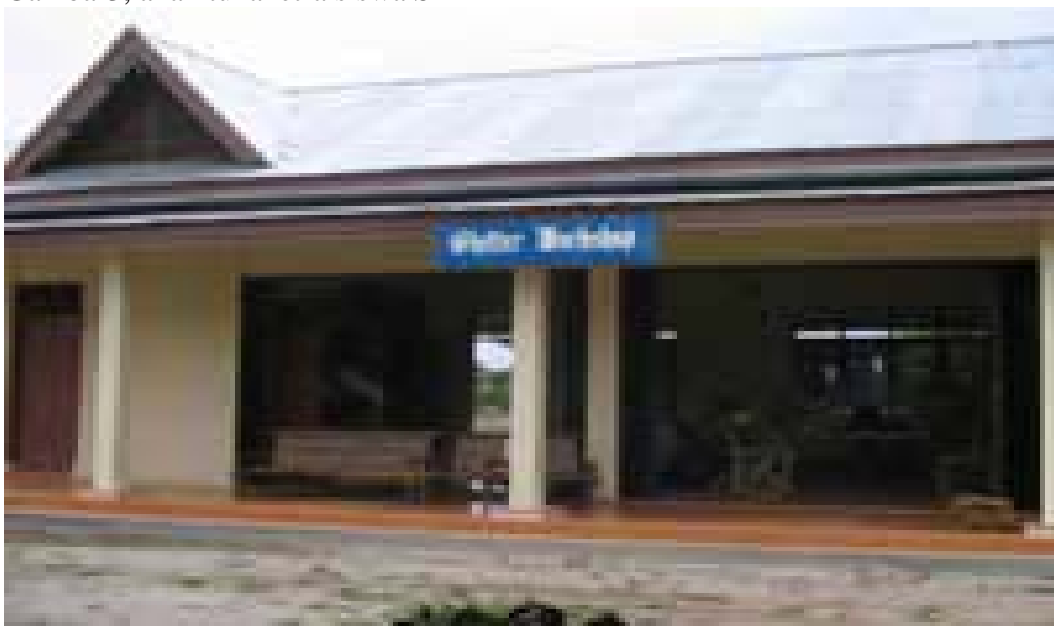
Gambar 4, gamabr Shelter Workshop (tempat anak tunanetra latihan ketrampilan)