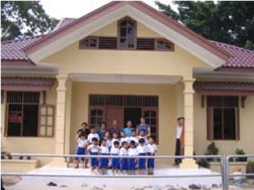
Gambar 1, gedung asrama untuk siswa sekolah SD, SMP, SMA