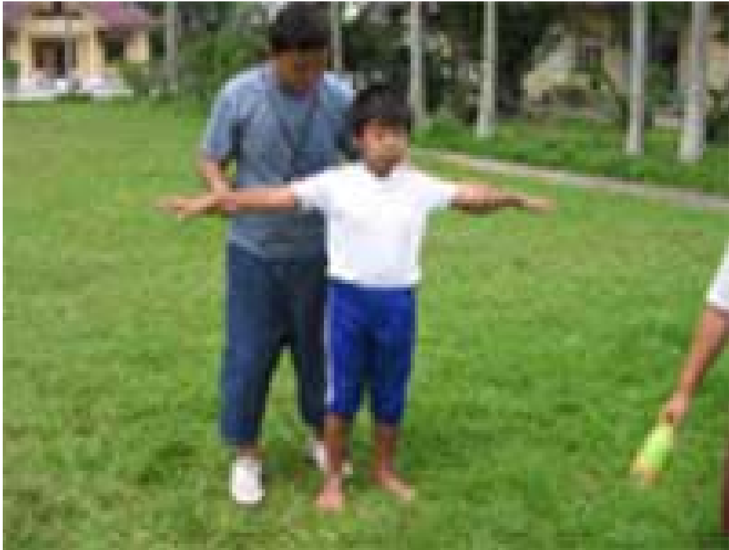
Gambar 5, tenaga pengajar sedang memberikan Individual training kepada siswa SD LB