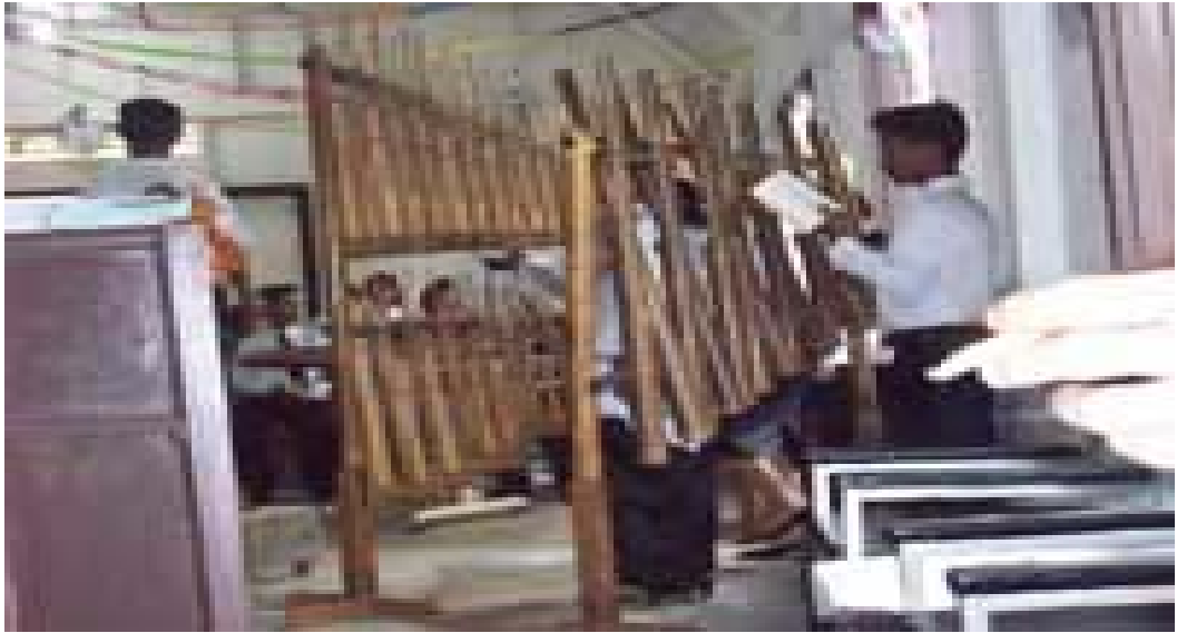
Gambar 8, anak tunanetra sedang latihan bermain angklung