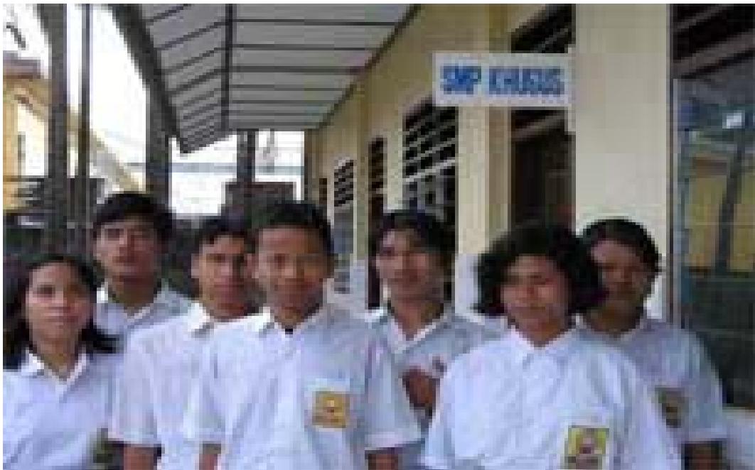
Gambar3, anak tunanetra siswa SMP LB