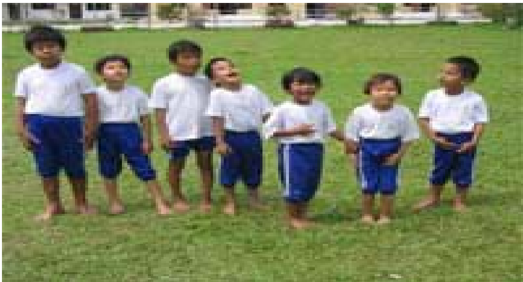
Gambar 2, anak tunanetra siswa SD LB