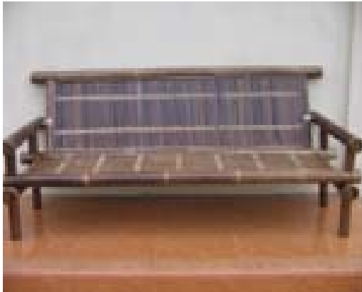
Kursi dan meja yang terbuat dari bambu