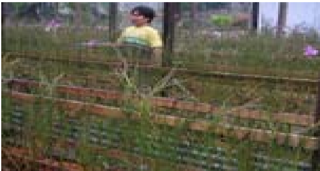
Gambar 7, anak tunanetra sedang bertani anggrek